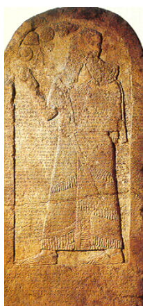
1.kép Kurkh sztéle vagy Monolit felirat

Az asszír eponim listák alapján tudjuk, hogy III. Sulmánu- asarídu (ie. 858-824) hatodik évében (ie.853) - ami Daian-Assur limmu hivatalnoki éve volt – vezette első hadjáratát nyugat felé. A szír, izraeli és júdabeli király seregei, valamint kilenc másik kisebb királyság csapatai együtt vették fel a harcot Qarqarnál, az Orontész folyó mentén az asszírokkal szemben. A sztéle felirata részletesen beszámol a csatáról, amelyben Akháb izraeli király neve is szerepel, aki 2000 harci szekeret vonultatott fel. Noha az asszír uralkodó állítása szerint legyőzte az ellenállók szövetségét, seregei mégis visszavonultak – azaz győzelme kétséges.